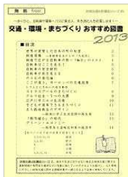
情報提供事業 (おすすめ図書)