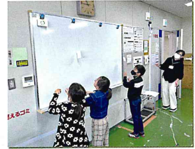
最終回での登り人形競争

親子エコ体験クラブでは、小学生と保護者が一緒に楽しみながら、工作や実験を通して環境のことを学ぶ講座として、6月から3月まで6回シリーズで実施しました。ほぼ隔月の日曜日午前というスケジュールもよかったという声が多く、親子17組の中ですべての回に参加した親子は6組でした。実施にあたって、子育て世代の推進員の協力もあり、クイズや工作、見学、実験など、すべての回が好評で、また参加したいという声も多数ありました。