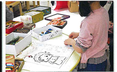
親子で楽しくオリジナル・エコバッグづくり