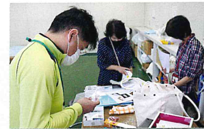
廃材プラ活用でストラップを作ろう

参加したみなさんには楽しく体験していただき、これからの生活にエコアクションをさらに増やしていただける内容で、とても好評でした。