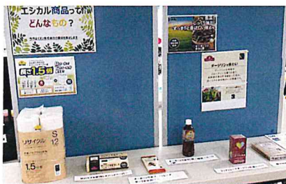
イオン（株）様提供のエシカル商品