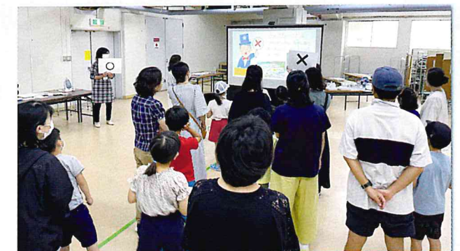
みなさんでエコクイズをしました。

2023年6月18日(日)2023年度親子エコ体験クラブの第1回(全6回)が開催され、12組の親子が参加しました。アイスブレイクでエコクイズを楽しんでもらった後、今回のテーマである食品ロスについて学びました。その後、グループに分かれて、みつろうラップ作りと紫キャベツを使った実験を行いました。最後にグループごとに今日の感想と関心があるエコについて、みなさんで意見交換をしました。とても楽しく参加できて次回以降も楽しみとの声もありました。