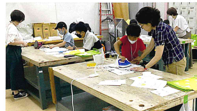
みつろうラップ作りでは、親子でアイロンがけをしました。