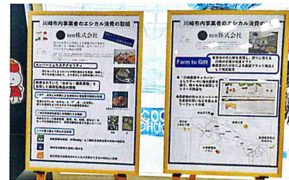
川崎市内の事業者の取組

動画はこのサイトからも視聴できますので、具体的なエシカル消費についてヒントが学べます。