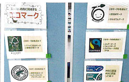
エシカル商品に関する認証マーク