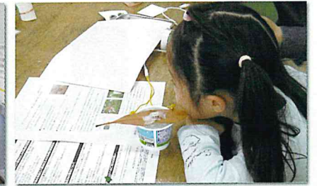
葉っぱから音楽が聞こえるかな？