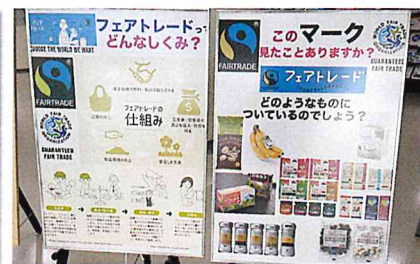
フェアトレードについて