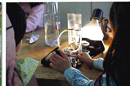
鉛筆から“泡ぷくぷく”燃料電池を体験しよう