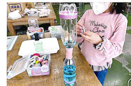
ペットボトルの中にトルネードを作ってみよう