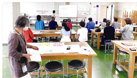
みつろうラップづくり