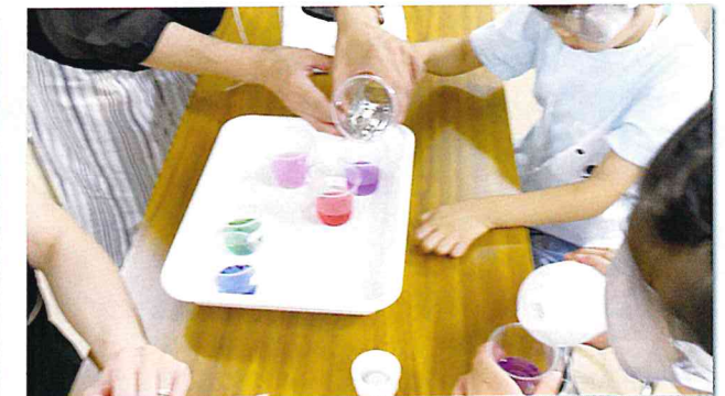
紫キャベツの液が、水が違くと違う色に変わります。