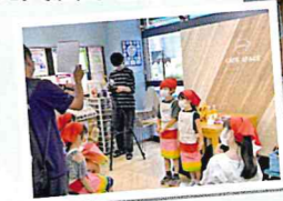
キッズYouTuber体験×環境学習(お仕事体験キッズデボー)