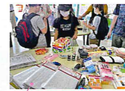
防災リュックの体験

地球温暖化が進むことにより異常気象が多くなることが予測されていたとあり、近年、大規模な災害が多く発生しています。そこで、脱炭素とともに「適応策・防災・減災」の重要性を伝える展示、セミナー、イベントを市民グループ、学生、行政、企業の協力により7月～9月の期間開催しました。イベントでは、断熱の大切さを人形劇で伝え、防災リュックに何を入れるかの他、かるたで学ぶ防災や熱中症、災害時のトイレ事情も知ることで、ふだんからの備えにつなげました。