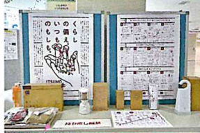
良品計画の協力による展示