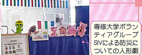
専修大学ボランティアグループSIVによる防災についての人形劇

地球温暖化が進むことにより異常気象が多くなることが予測されていたとあり、近年、大規模な災害が多く発生しています。そこで、脱炭素とともに「適応策・防災・減災」の重要性を伝える展示、セミナー、イベントを市民グループ、学生、行政、企業の協力により7月～9月の期間開催しました。イベントでは、断熱の大切さを人形劇で伝え、防災リュックに何を入れるかの他、かるたで学ぶ防災や熱中症、災害時のトイレ事情も知ることで、ふだんからの備えにつなげました。