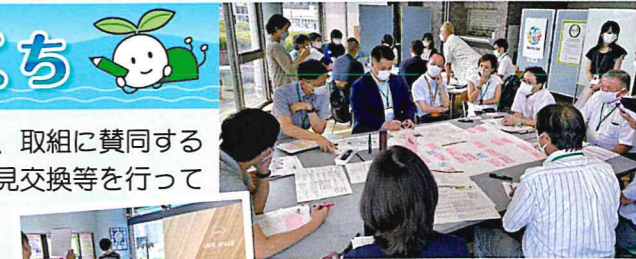
推進会議ワークショップ

11月12日(土)にはJR武蔵溝ノ口駅前などで体験型イベントを予定していますので、ぜひ御参加ください。