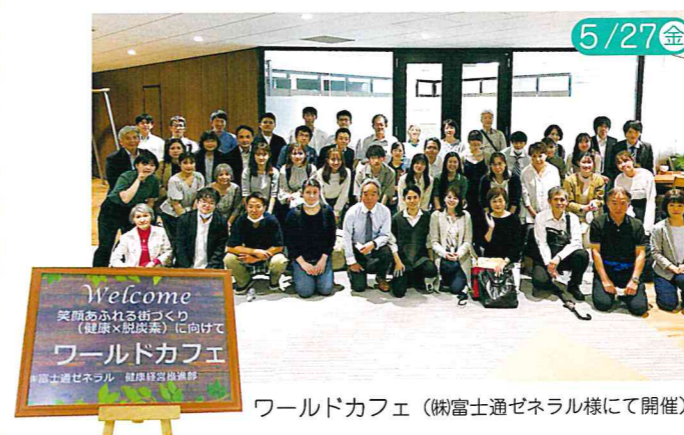
ワールドカフェ (株式会社通ゼネラル様にて開催)

そのひとつとして、市民・地域団体・事業者・行政等が連携して脱炭素社会の実現に向けたプロジェクトの創出を目指す「脱炭素アクションみぞのくちプロジェクト創出部会」の取組みを進めています。現在、この部会では、食とエネルギー、プラスチック廃棄物、環境学習・教育などをテーマとしてイベントの企画や参加も含め活動の輪を広げています。