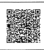
COOL CHOICE 賛同登録用QRコード

COOL CHOICEとは、2030年度に温室効果ガスの排出量を2013年度比で46%削減するという目標達成のため、脱炭素社会づくりに貢献する製品への買換え・サービスの利用・ライフスタイルの選択など、地球温暖化対策に資する「賢い選択」をしていこうという取り組みのことで、スマートフォンやタブレット端末で、QRコードを読み取り、COOL CHOICE ホームページ内の登録画面で賛同をお願いします。