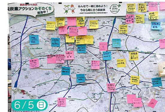
エコシティかわさきフェス2022出展 (emパークにて開催)