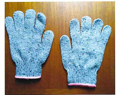
反毛によって作られた軍手

衣類の3Rで一番大切なのは リデュース ！手に入れたら、長く着ましょう。着たら洗うではなく、適切に洗濯して、長持ちさせましょう。