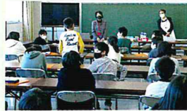
川崎市立宮崎小学校

廃棄物の法律や衛生面(HACCP)などの関係で、数年前から市内の学乳パックがリサイクルされず燃やされていることを知り、関係機関と相談しながら、飲み終わった牛乳パックを、開いて、すすいで、乾かして、古紙業者にリサイクルルートに乗せてもらうという取組を市内の小中学校と進めています。授業の後、子どもたちから自主的に取組みたいという機運が盛り上がり、各クラスや学校での取組につながってきています。