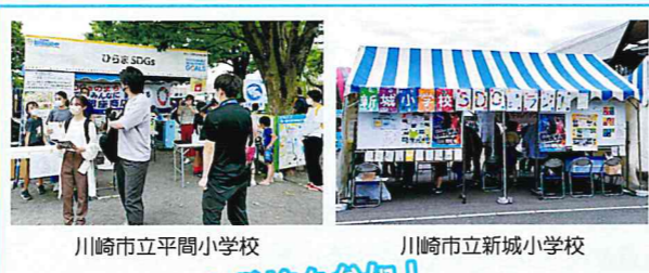
川崎市立平間小学校