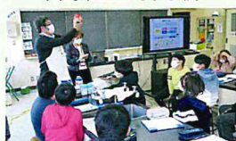
川崎市立西菅小学校