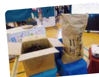
川崎市立高津小学校