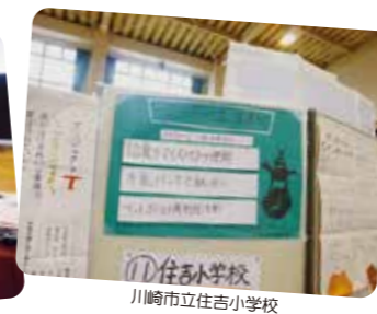
川崎市立住吉小学校

2月9日(土)、川崎市内の小学校18校が参加して、「エネルギー・環境子どもワークショップin川崎2019」が川崎市立大戸小学校の体育館で開催されました。川崎市地球温暖化防止推進員プロジェクトが環境出前授業を行った学校もあり、授業内容が発展された興味深い発表でした。