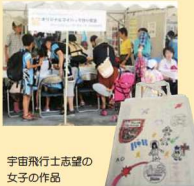
宇宙飛行士志望の女子の作品

国際宇宙ステーションと等々力(フロンターレ)との生交信イベント(8月16日)に先立ち、8月6日のホームグラウンドイベントにグリーンコンシューマーグループかわさきが出展しました。ふるん太くんやロージーちゃんのスタンプが中原区から用意され、楽しいマイバッグ作りとなりました。