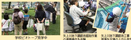
学校ビオトープ見学中

7月26日、小雨の中、身近な地球温暖化適応策を学ぶ「たかつエコシティツアー」を、高津区の見学事業として開催。区内の農地、学校ビオトープ等を見学。洪水から暮らしを守る貯留トンネル「矢上川地下調節池」工事現場は、圧巻でした。