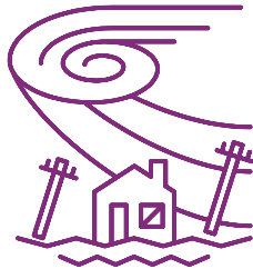
強い台風 Severe typhoon