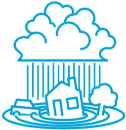
集中豪雨 Torrential rain